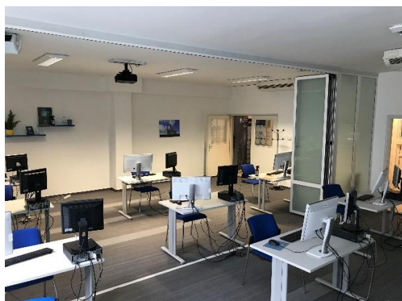
Soba Atlantic, Baštijanova 52A, Zagreb